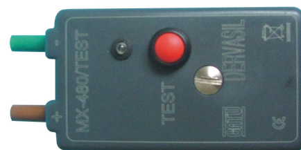
MX 480 / test