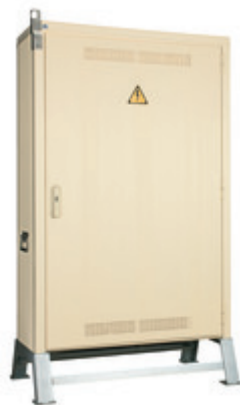
Armoire de comptage mobile vue de côté